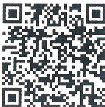
图 3 “慧展华彩”对接巡展活动专项对接