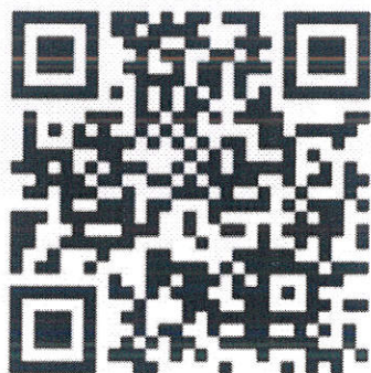
图 1 中国国际“互联网+”大学生创新创业大赛官方服务窗口